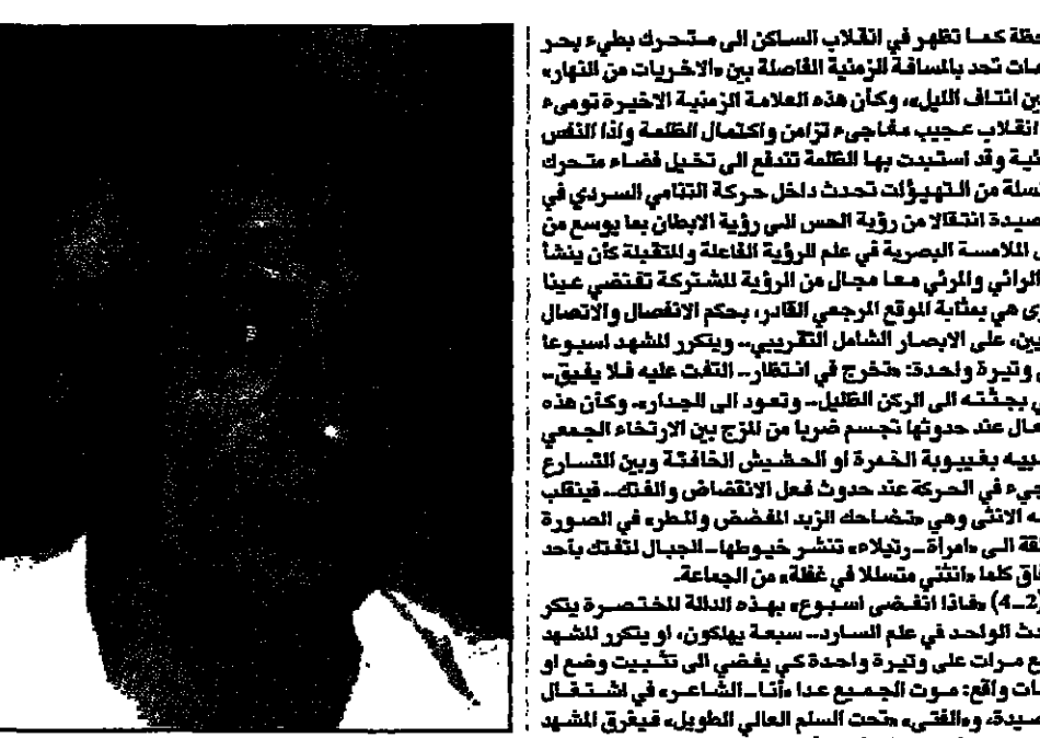
حسب الشيخ جعفر

بيروت: رويترز، قالت مجلة «البيئة والتنمية» في عددها الأخير أنها أصبحت منذ هذا العدد تلعب على ورق يعاد تصنيعه.